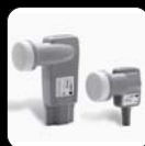
Figura de Ruido: 0,2 dB. Desacoplo Polaridad Cruzada: > 25 dB LNB 201 Ref. 86129 (Universal) LNB 204 Ref. 86131 (Quattro)

LNB 222 Ref. 86132 (Twin - 2 vecinos) LNB 244 Ref. 86134 (Quad - 4 vecinos)